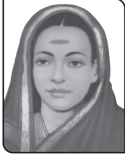
सावित्रीबाई फुले (भारतातील आद्य शिक्षिका व स्त्री शिक्षणाच्या प्रवर्तक)